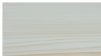
LEACHED AND SOAPED SPRUCE