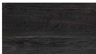
BLACK BURNED+ OILED OAK