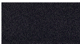
STEEL BLACK POWDER COATED