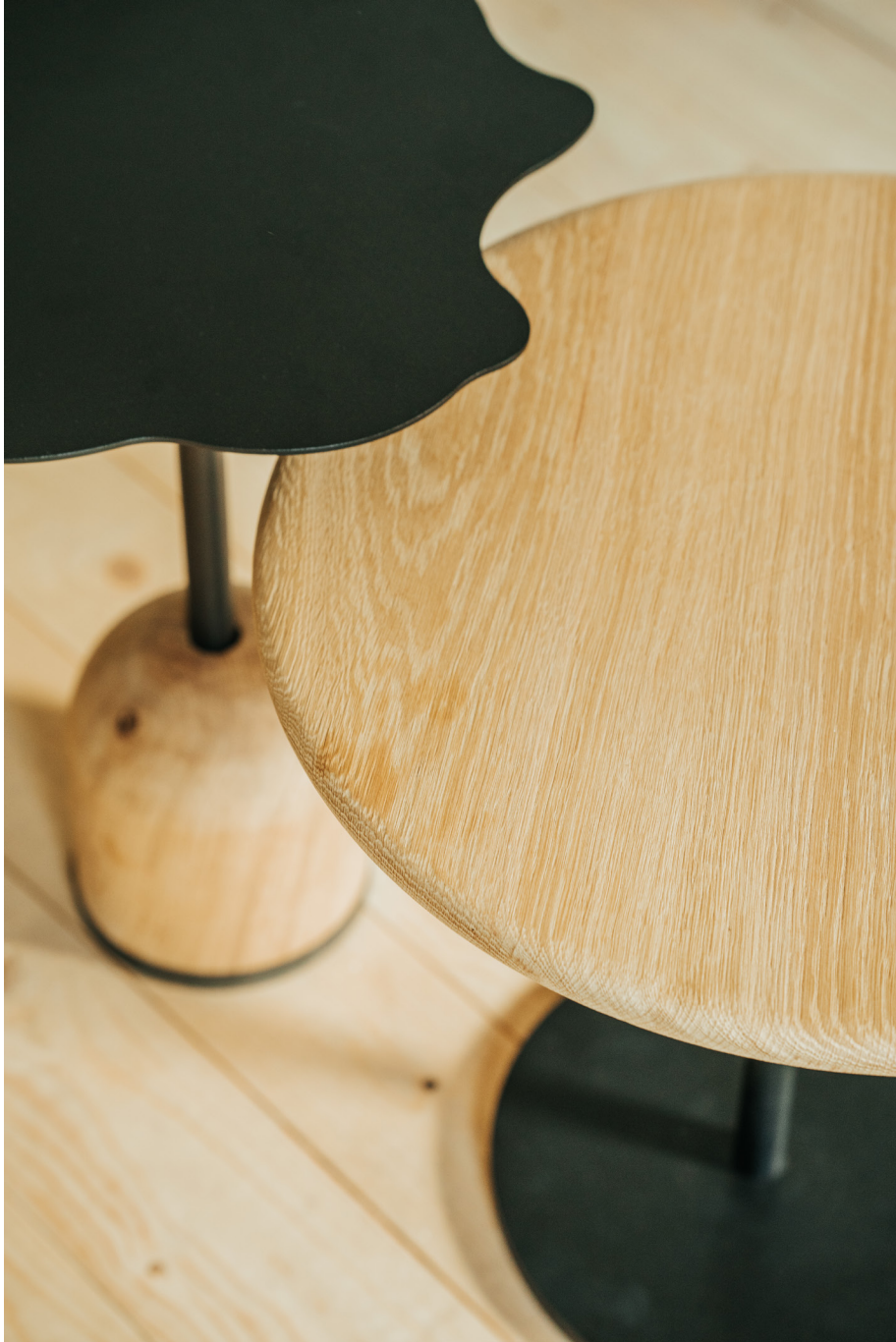
Norman Coffee Table by Rohdesign Studio