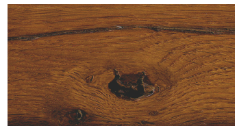
SOAPED RECLAIMED OAK (handle)