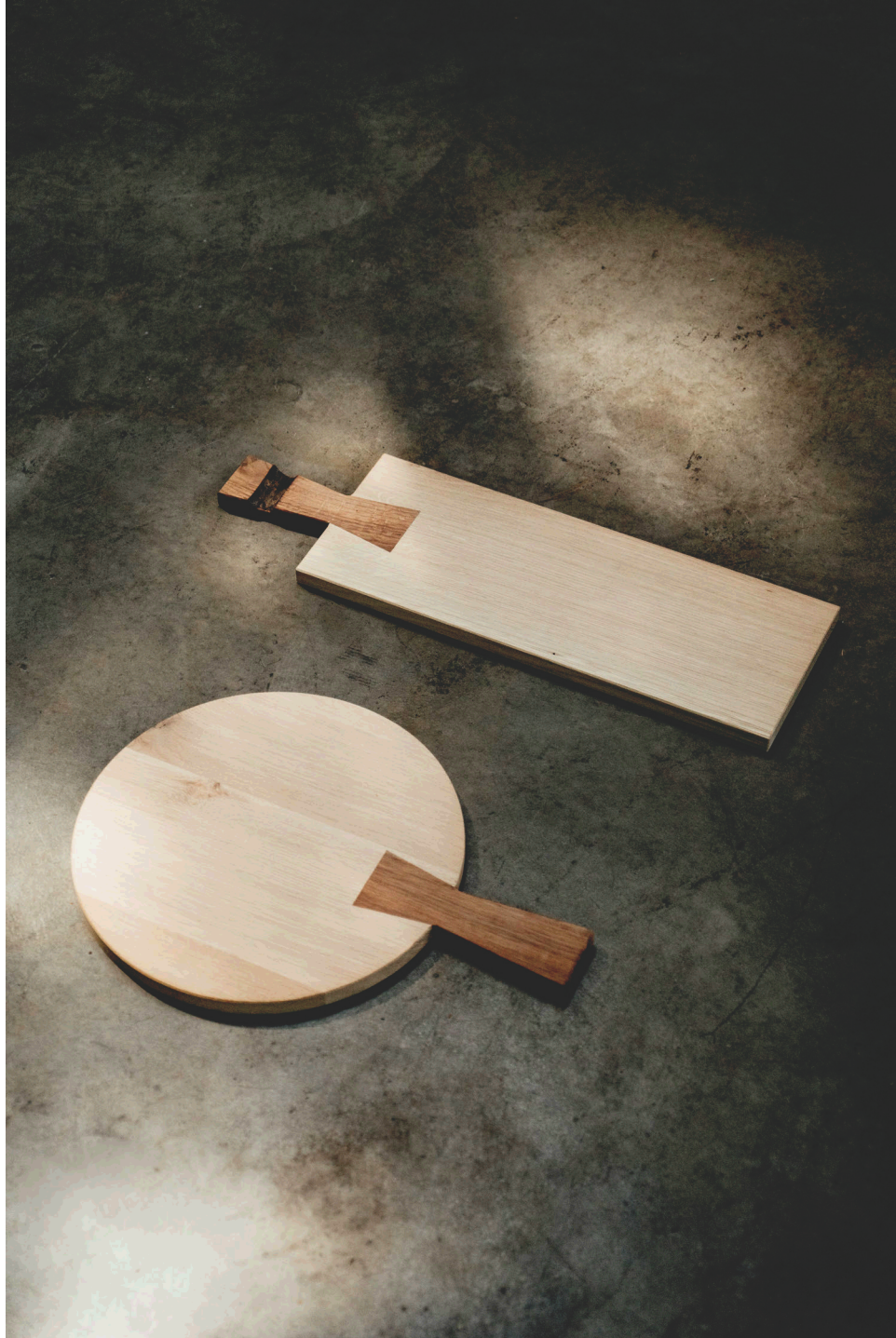
Brad Board by Rohdesign Studio