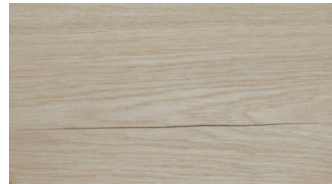
SOAPED NATURAL OAK (board)