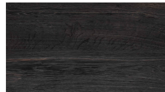
BLACK BURNED+ OILED OAK