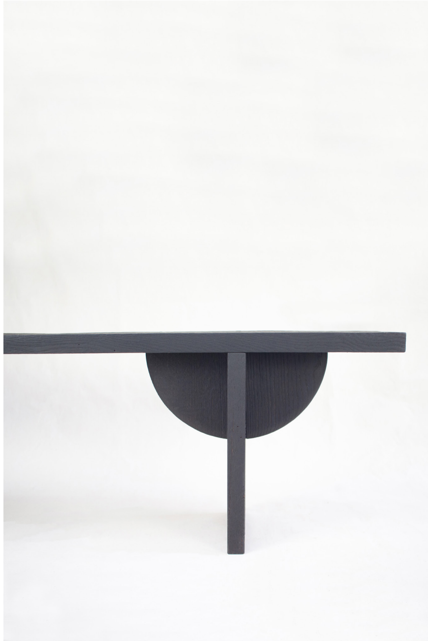
Iko Bench by Rohdesign Studio