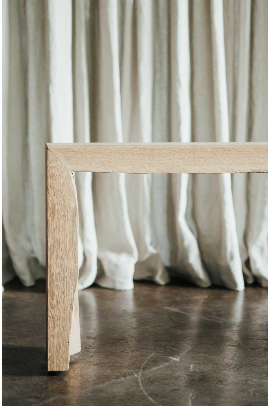
Maki Bench by Rohdesign Studio