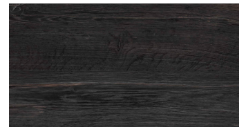
BLACK BURNED+ OILED OAK