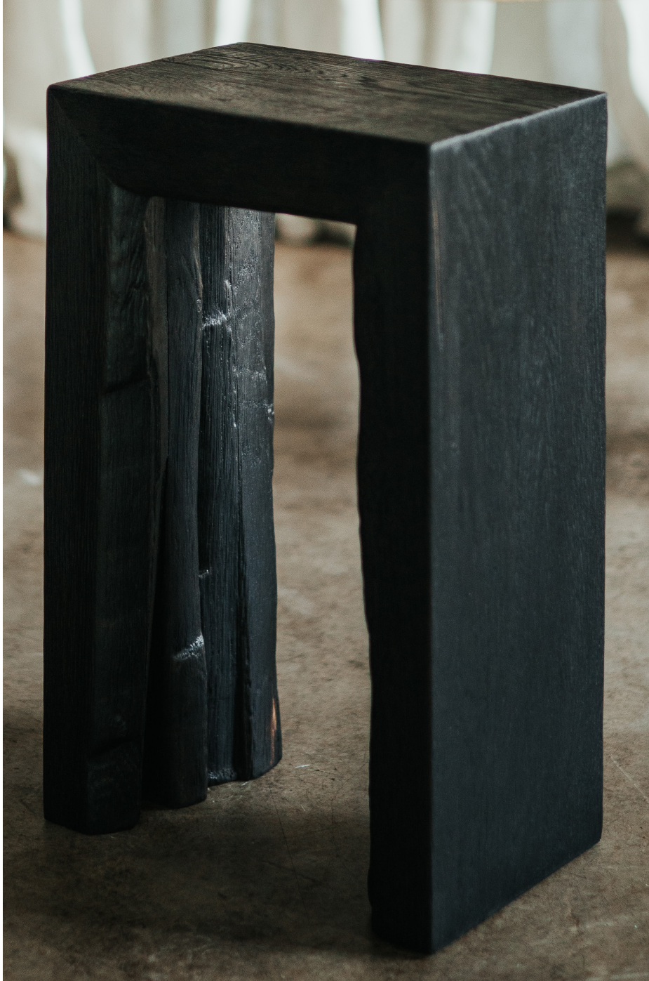
Maki Stool by Rohdesign Studio