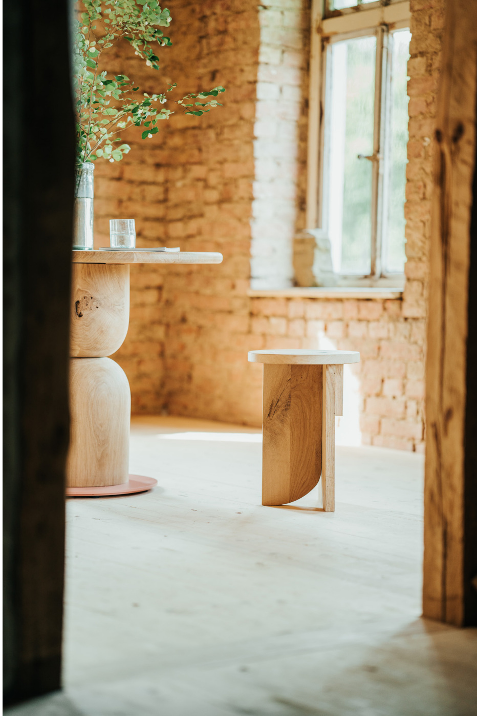
Tibu Stool by Rohdesign Studio