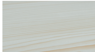
LEACHED AND SOAPED